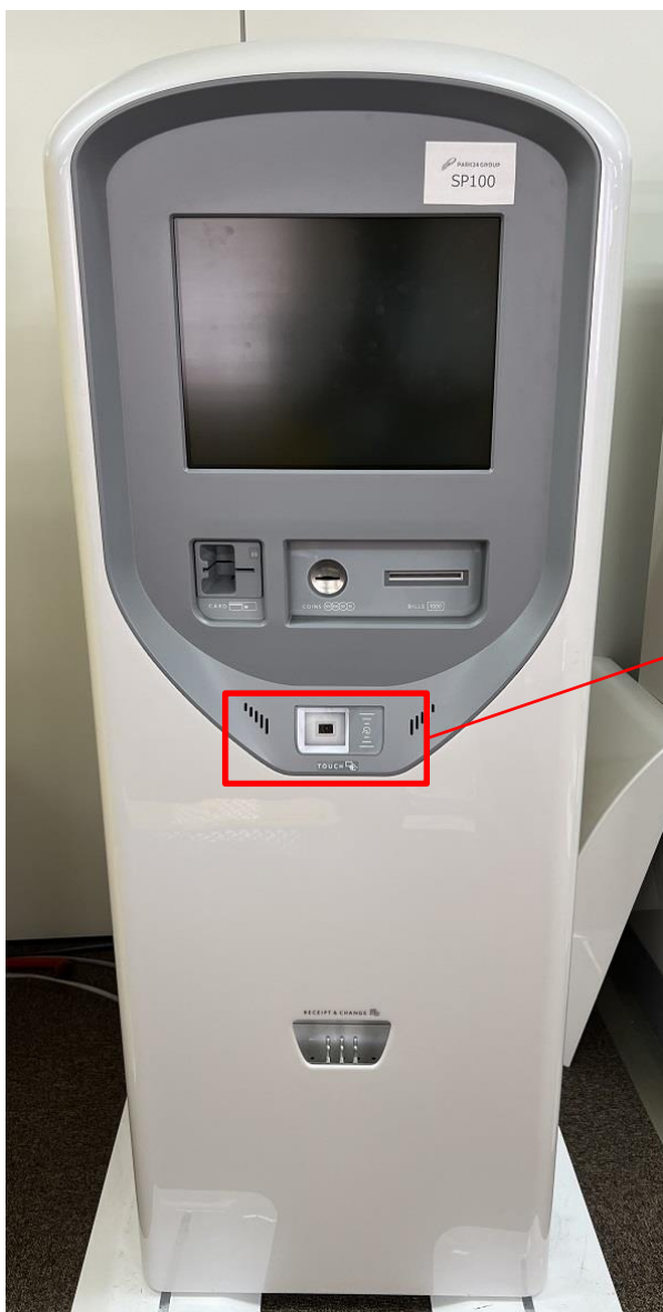
※QR駐車サービス券（赤枠内）